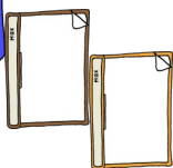
Hefte Ordner Schnellhefter