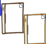
Hefte Ordner Schnellhefter